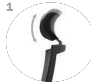
1 조절형 헤드레스트 사용자 체형 및 자세 변화에 따라 적절한 높이로 손쉽게 조절 가능 ADJUSTABLE HEADREST According to the user's body type and posture, it is possible to adjust the height.