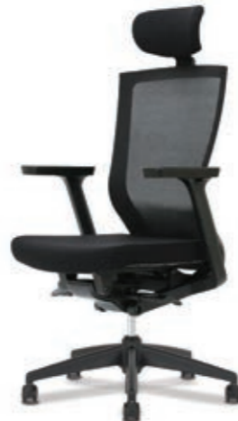
D5-301H W650 x D590 x H1120~1220