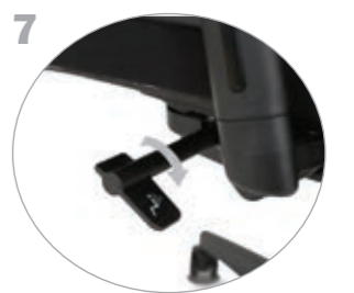
7 리미트 기능 / 4단 사용자의 자세에 따라 틸팅되는 각도의 범위 선택 가능 4 DIFFERENT RECLINING FUNCTIONS According to the load applied to the seat's backrest, the chair supports a user's back with moderate tension.