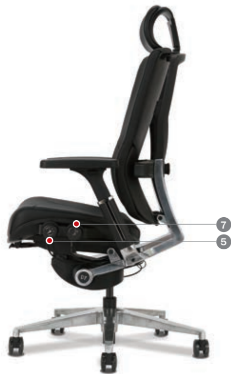
측면 뷰 SIDE VIEW

럼버서포트 조절 방법 등판 다이얼을 눌러 시계방향으로 돌릴 시 양쪽의 럼버서포트가 허리에 밀착 강도 조절 다이얼을 당기면 풀려서 원위치 MANUAL OF ADJUSTING LUMBAR SUPPORT As pushing the dial and turning it clockwise, the backrest supports on both sides to move closer towards the user's back. When pulling and pushing the dial, it can be turned on and off.