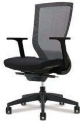
D5-350 W645 x D585 x H980~1070