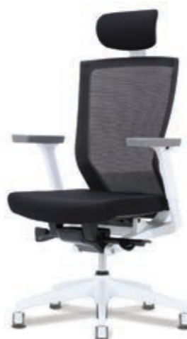
D5-301WH W650 x D590 x H1120~1220