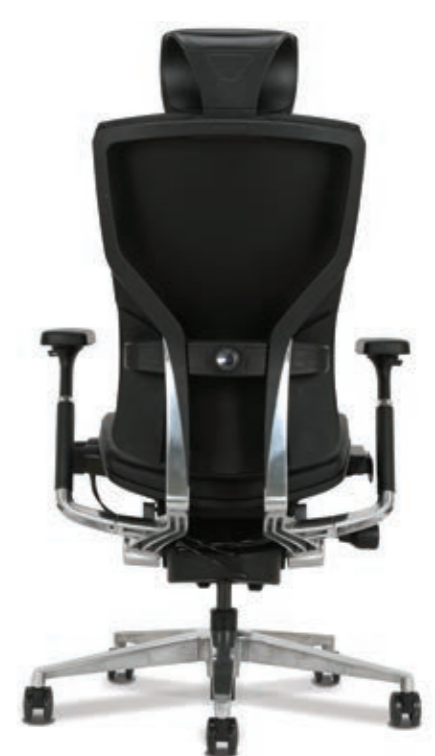
럼버서포트 사양 LUMBAR SUPPORT TYPE