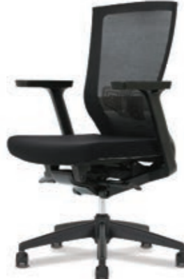
D5-301L W650 x D590 x H935~1035