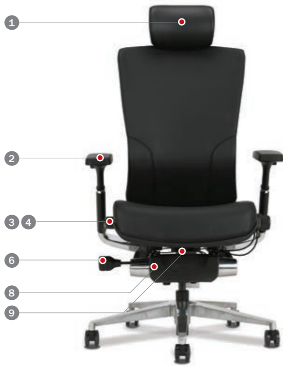
정면 뷰 FRONT VIEW