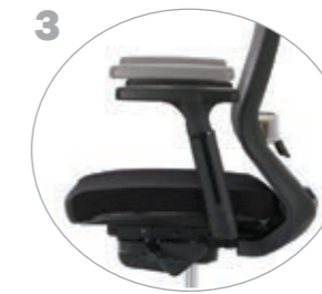
3 조절형 암레스트 높이, 전후 위치 이동과 각도 회전 가능 ※ 고정형 팔걸이 선택 가능 / 팔걸이 패드 변경 가능 ADJUSTABLE ARMREST It is possible to adjust the armrest's height, and rotate its angle. ※ It is possible to choose a fixed armrest and different type of armrest pad.