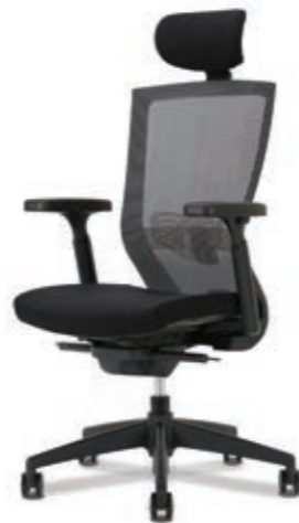
D5-351HL W630 x D585 x H1170~1260