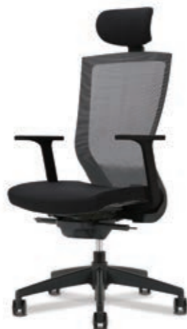
D5-350H W645 x D585 x H1170~1260