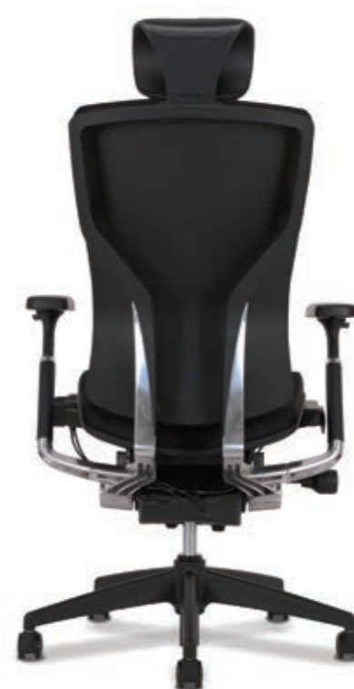
일반 사양 STANDARD TYPE