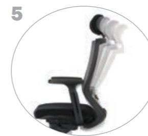
5 싱크로나이즈드 틸팅 등판과 좌판이 각기 다른 각도로 기울어져 가장 편안한 상태로 지지 (체중 감응형 틸트) SYNCHRONIZED TILTING FUNCTION The backrest and seat can be tilted to the different angles to allow for the most possible comfort. (Tilting tension is controlled automatically by user's weight.)