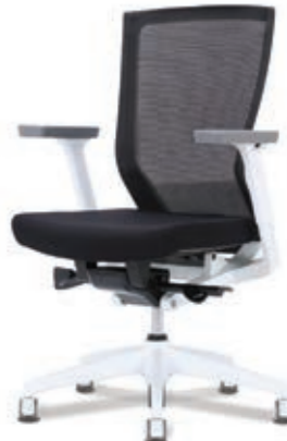
D5-301W W650 x D590 x H935~1035