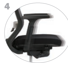
4 좌판 깊이 조절 좌판 하단 우측 손잡이를 당겨 좌판의 깊이 조절 가능 ADJUSTMENT SEAT DEPTH The seat of the chair can be adjusted by pulling the handle on the right side of the bottom of the chair.