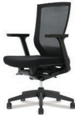
D5-301 W650 x D590 x H935~1035