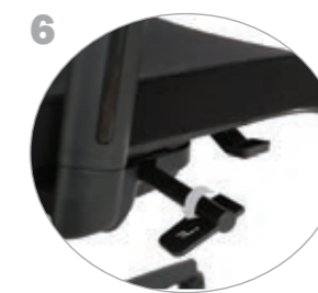
6 좌판 높이 조절 의자 하단 우측 손잡이를 이용해 좌판을 사용자에게 맞춰 높이 조절 가능 ADJUSTABLE HEIGHT The height of the chair can be adjusted by turning the lever on the right side of the bottom of the chair.