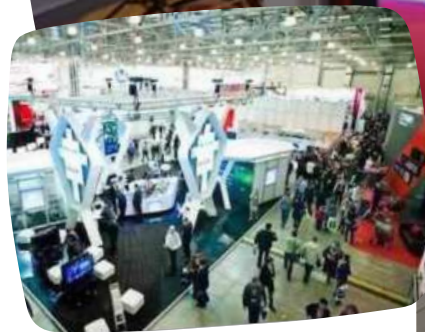
Atakent Exhibition Centre